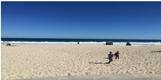
Scarborough Beach 昼

パースは西オーストラリアに位置する都市です。“世界一美しい街”とも呼ばれるほど自然がとにかくきれいでした。また、日本とは季節が逆になるため僕が行った時、パースは冬でした。しかし、冬といっても雪が降ることはなく比較的暖かかったです。