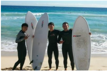
Surfing with Italian & Japanese